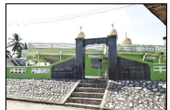
มัสยิดบาร์โฮม หมู่ ๗