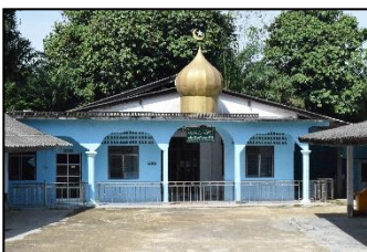
มัสยิดมัสยิดอรัระหะซีตี หมู่ ๔