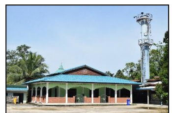
มัสยิดอัลอะหะมาตี หมู่ ๔