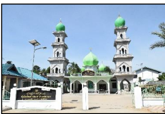
มัสยิดอรัระหะมะห์ หมู่ ๑