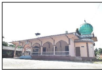
มัสยิดอิสติกอมะห์ หมู่ ๖