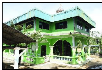
มัสยิดนะห์ฎอตุลอิสลามียะห์ หมู่ ๕