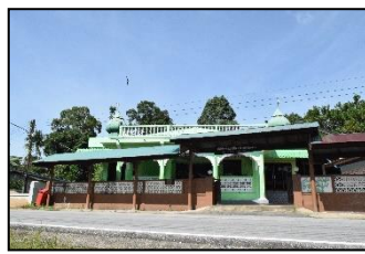
มัสยิดยาติต หมู่ ๒