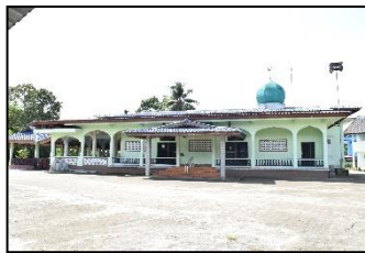
มัสยิดนูรูอิฮซาน หมู่ ๓