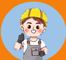
ด้านอาชีวอนามัย