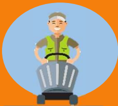
ผู้ปฏิบัติงาน