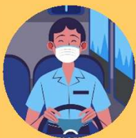
พนักงานขับรถ