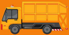
ยานพาหนะ

การเลือกรูปแบบการเก็บรวบรวมของเสียอันตรายจากชุมชน มีหลายรูปแบบตามความเหมาะสมกับวิธีการแยกทิ้ง โดยพิจารณาจากความพร้อมและศักยภาพขององค์กรปกครองส่วนท้องถิ่นประกอบ