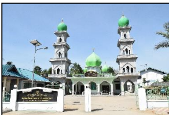
มัสยิดอรรเราะห์มะห์ หมู่ ๑