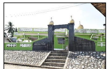
มัสยิดบาร์โฮม หมู่ ๗