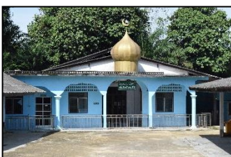
มัสยิดมัสยิดอัลอซซีดี หมู่ ๔