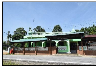
มัสยิดยาดีด หมู่ ๒