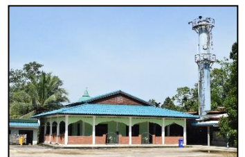
มัสยิดอัลอะห์มาดี หมู่ ๔