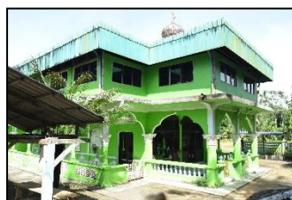
มัสยิดนะห์ฎอตุลอิสลามียะห์ หมู่ ๕