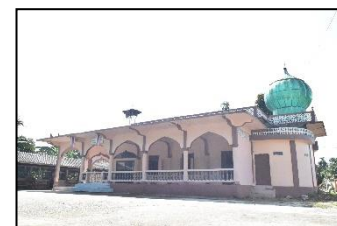
มัสยิดอิสติกอมะห์ หมู่ ๖