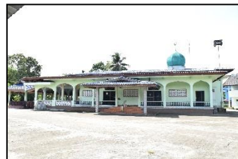
มัสยิดนูรูอิฮซาน หมู่ ๓